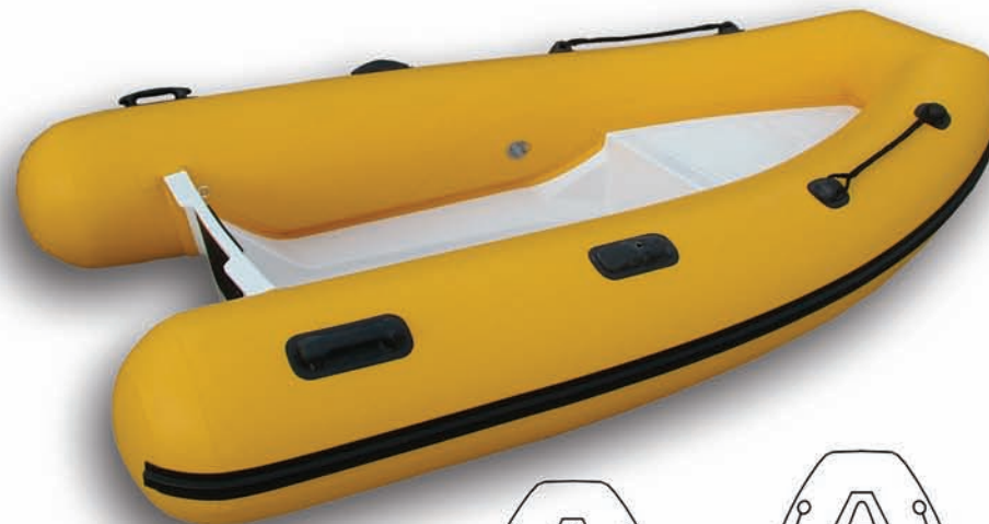
FOCCHI 250 flat