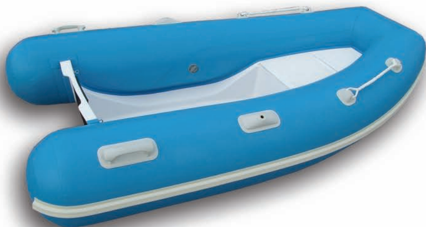
FOCCHI 230 flat